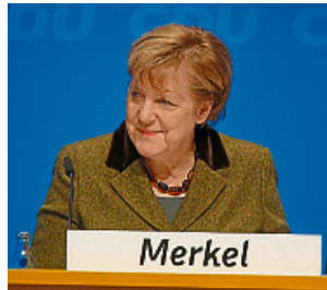
Angela Merkel kommt nach Münster.