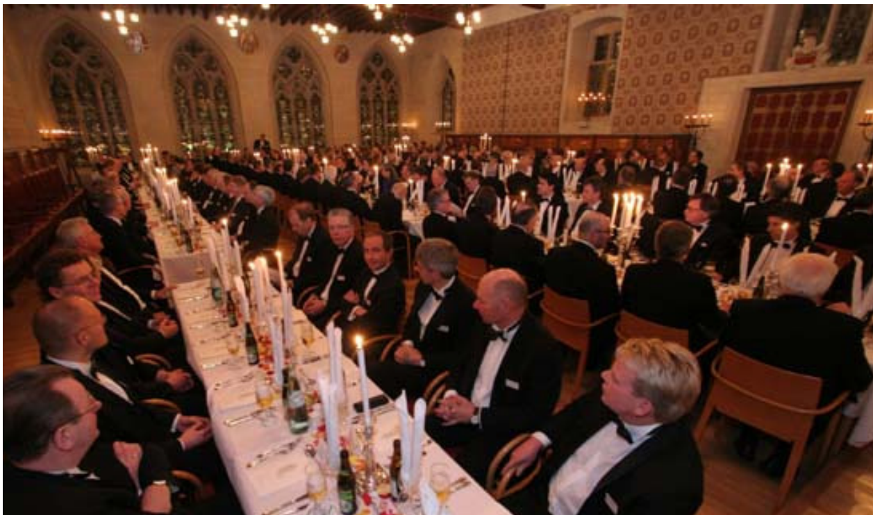
Der Rahmen ist festlich, das Menü vergleichsweise bescheiden: Beim Kramermahl wird im Rathaus traditionsgemäß Grünkohl mit Mettwurst serviert.