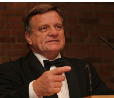
Ehrengast und Festredner beim Kramermahl im münsterischen Rathaus: Hartmut Mehdorn, Vorstandsvorsitzender der Deutschen Bahn AG.