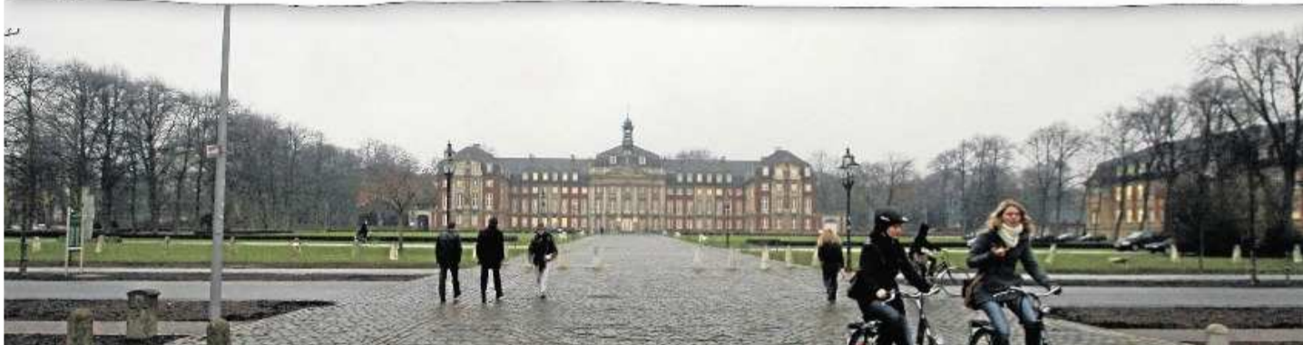
Der spannendste Entwurf im direkten Vergleich mit der Wirklichkeit: Oben die Zeichnung der Architekten mit See und Bebauung entlang der Straße aus Richtung Frauenstraße, unten der Istzustand.

Fotos Etzkorn/Bolles & Wilson, Montage Naumann